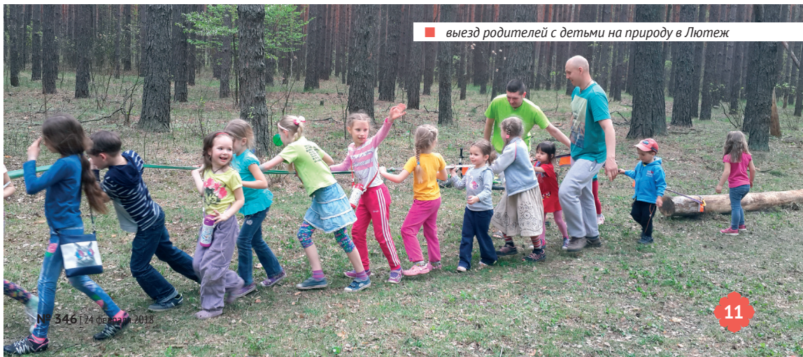
■ выезд родителей с детьми на природу в Лютеж

Джай Шилой прабху на «Бхакти Сангаме - 2012»