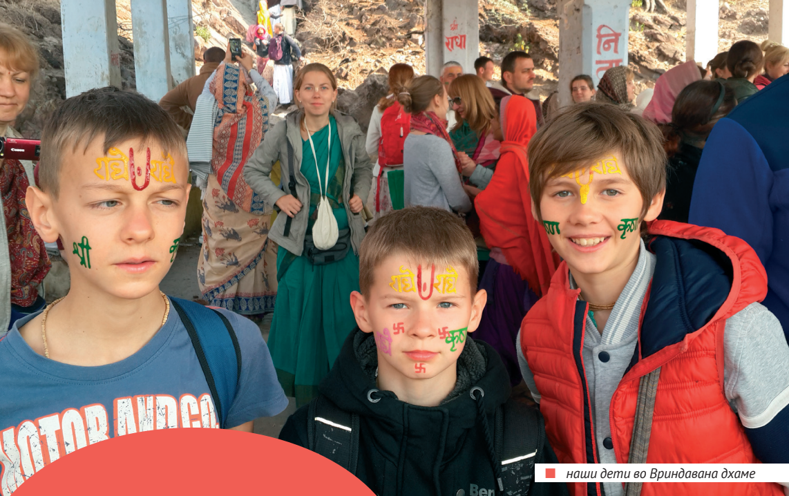
■ наши дети во Вриндавана дхаме