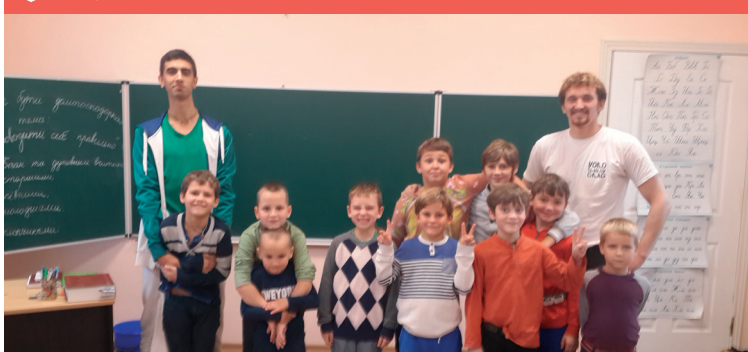
■ Занятия по актёрскому мастерству

3. Дать энергию ребенку, когда проблемы не возникает, хотя и могла бы быть: «Ты сидишь так аккуратно на своем месте и больше не щипаешь соседку. Это говорит о том, что ты такая прилежная!» Почему ребенок щипает другого ребенка? Он хочет получить энергию.