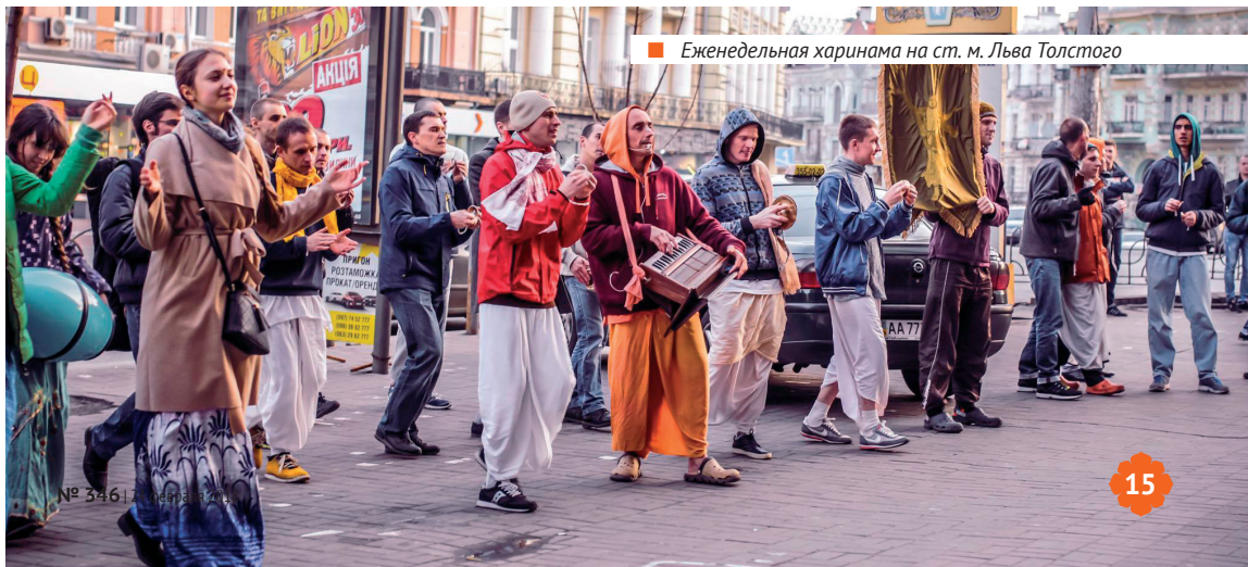
Еженедельная харинама на ст. м. Льва Толстого